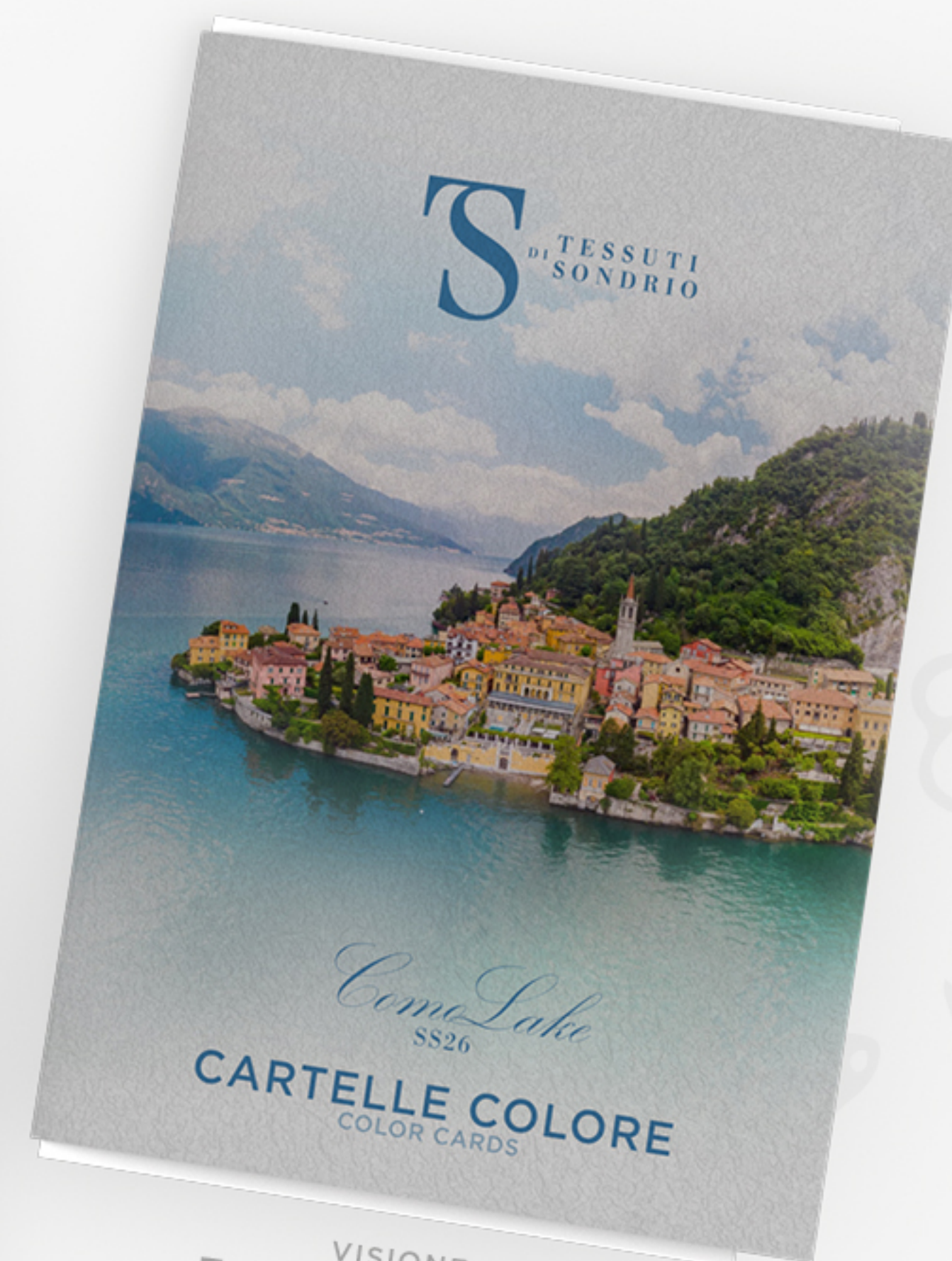
VISIONE 3D CON FOGLI