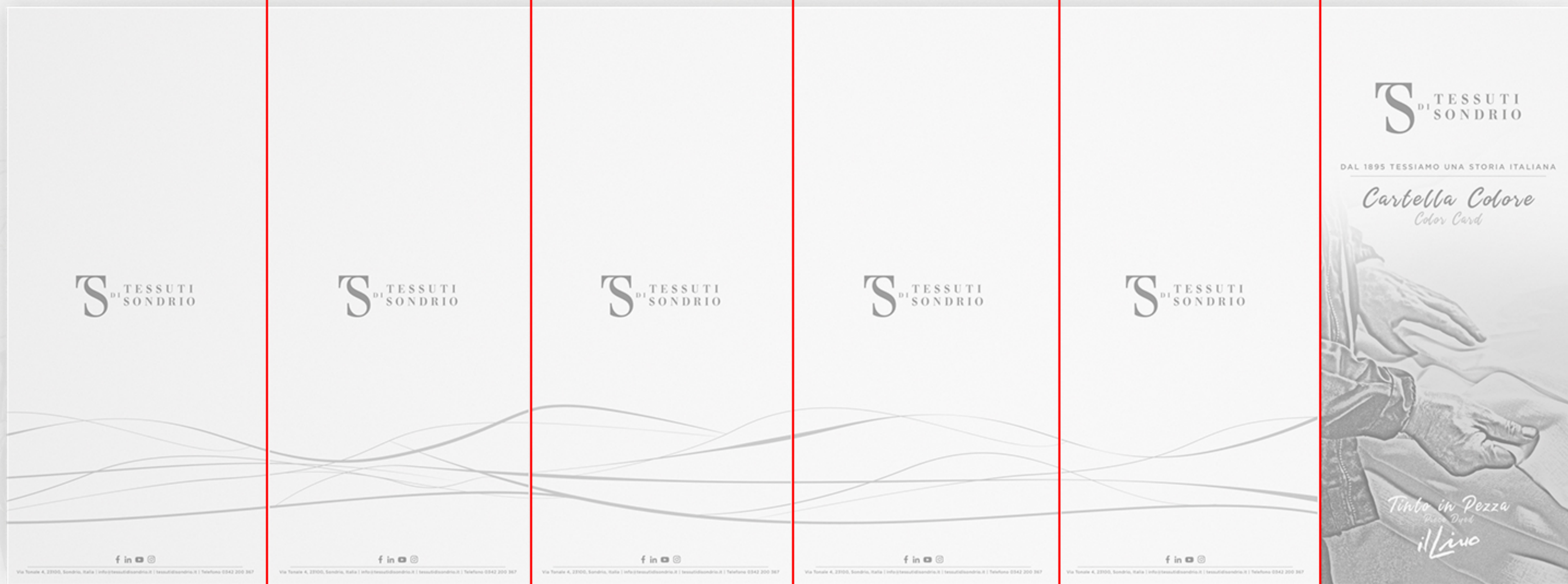
CARTELLA COLORE "IL LINO": 6 ANTE - RENDER BIANCA - PIEGA A FISARMONICA