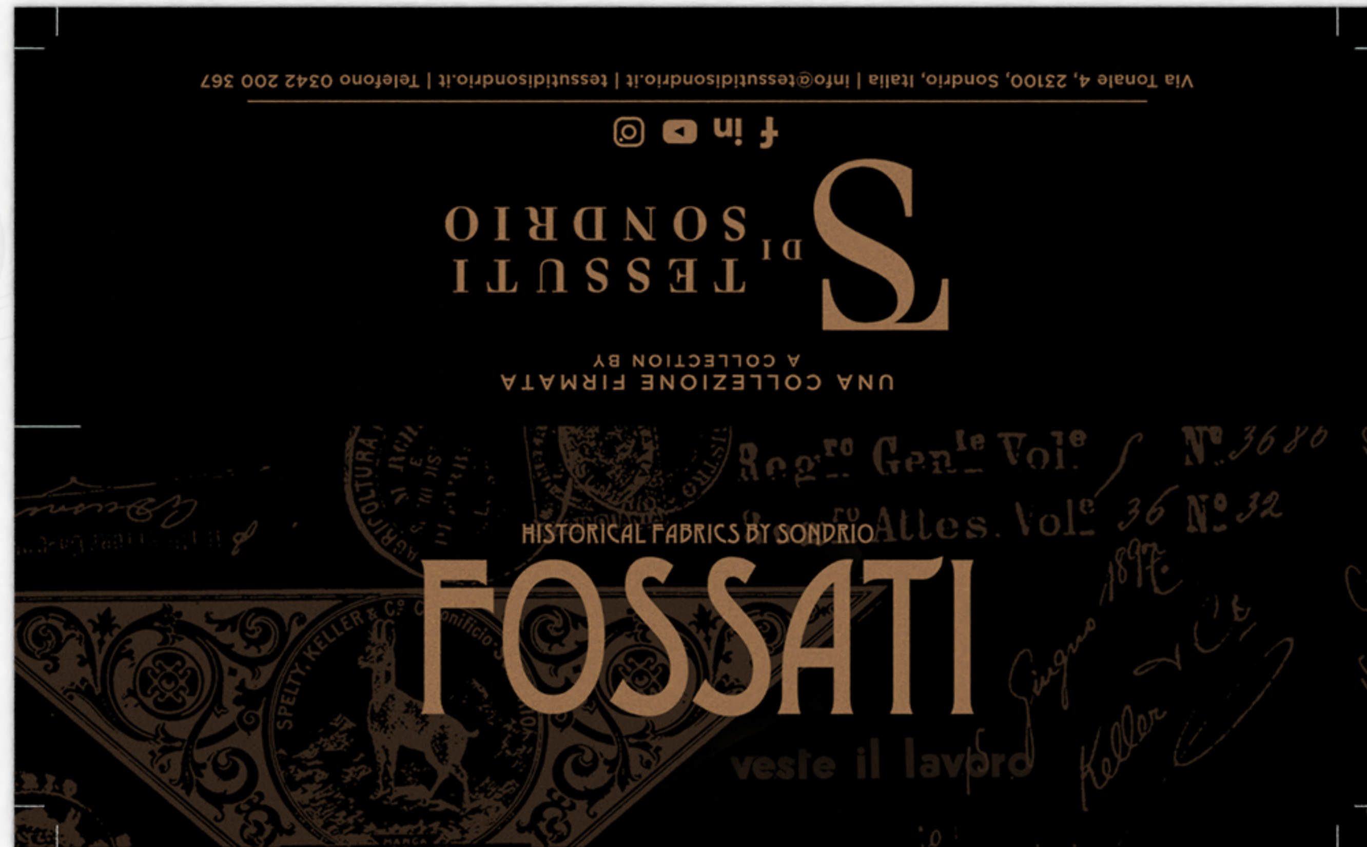
VISIONE FRONTALE: STAMPA IN SOLA BIANCA (FORMATO APERTO 9X15CM)