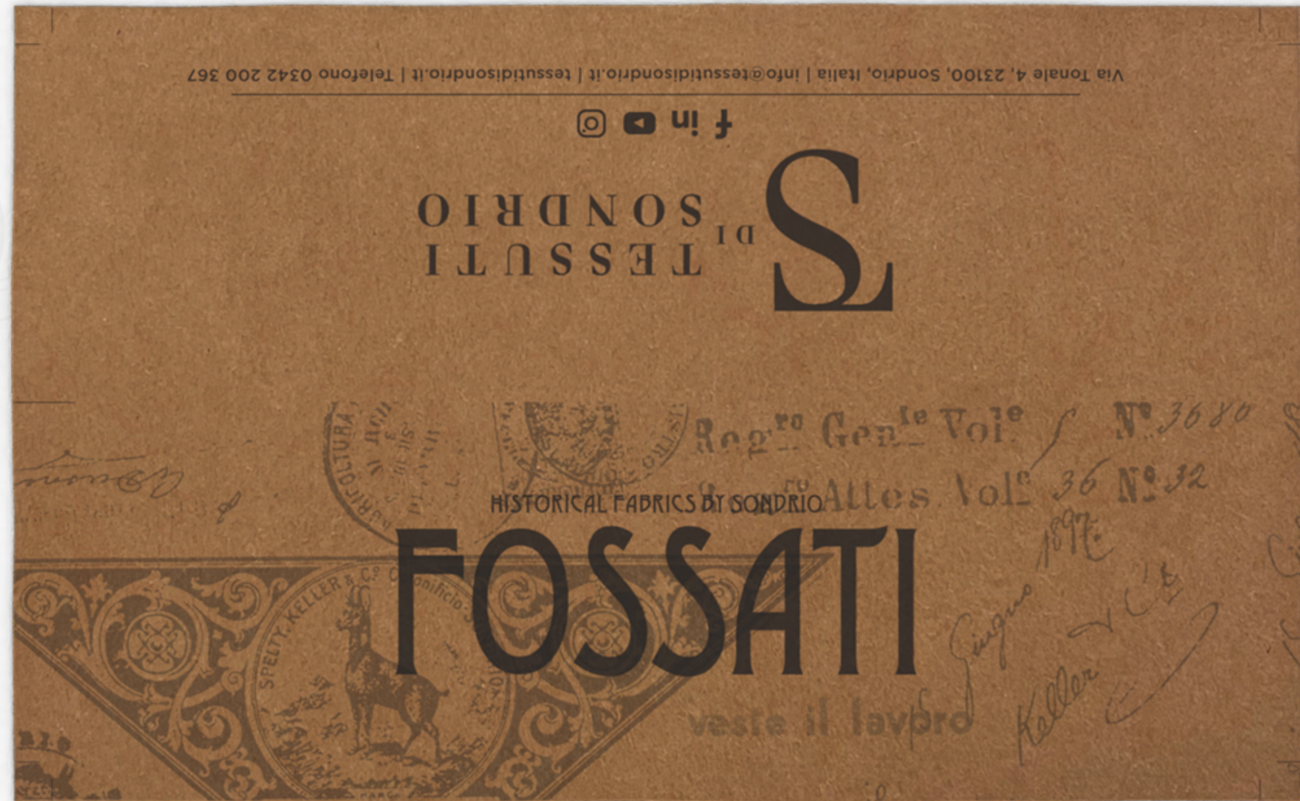
VISIONE FRONTALE: STAMPA IN SOLA BIANCA (FORMATO APERTO 9X15CM)