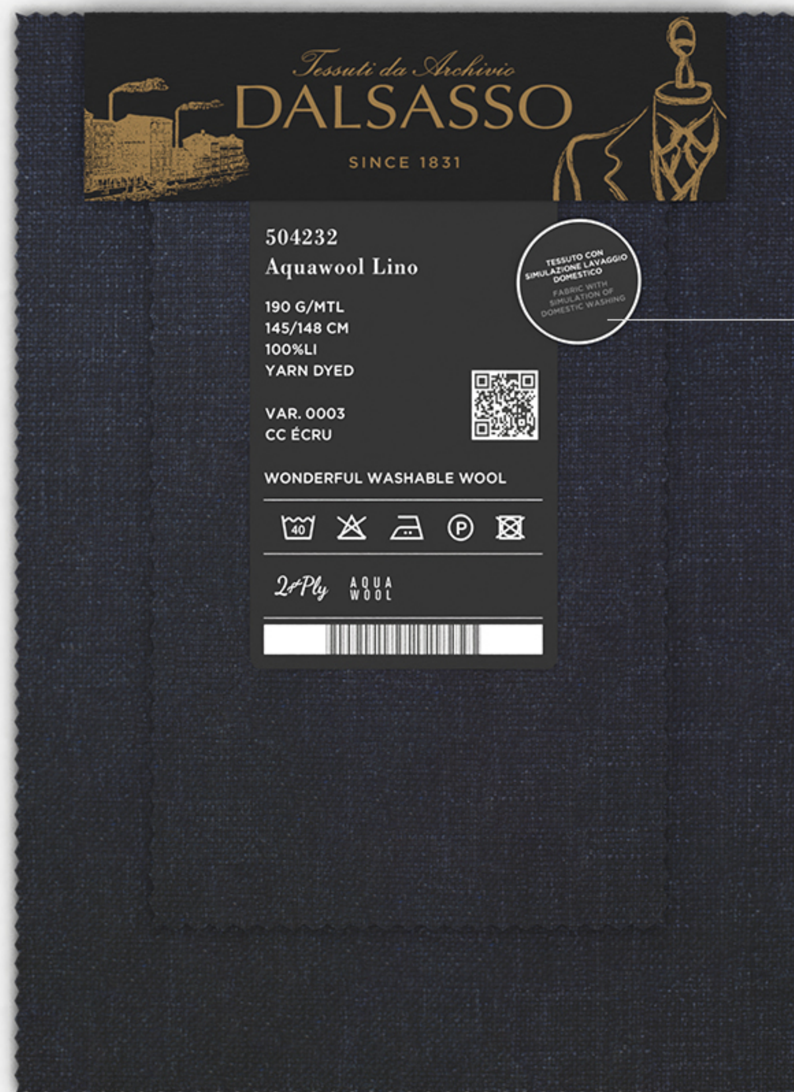
ESEMPIO VISIVO APPLICAZIONE BOLLINO