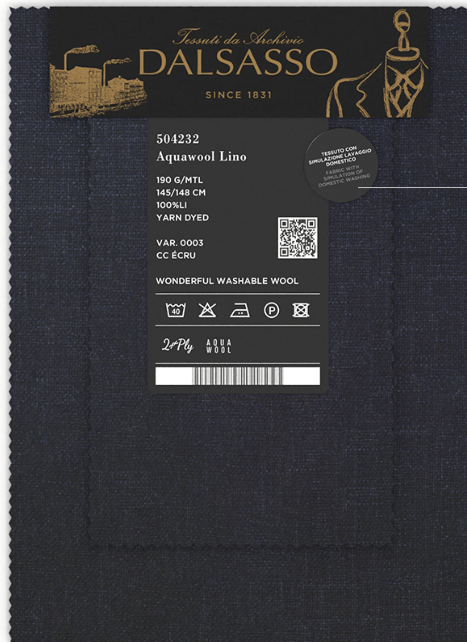
ESEMPIO VISIVO APPLICAZIONE BOLLINO